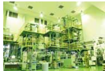
CMP インフレーション工場